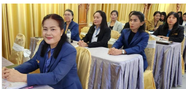
การประชุมวิพากษ์แผนพัฒนาการศึกษา พ.ศ. 2566 - 2570 (ฉบับทบทวน พ.ศ. 2566) และแผนปฏิบัติการประจำปีงบประมาณ พ.ศ. 2567 ในวันที่ 7-8 ธันวาคม 2566 ณ บ้านพักรับรองของการไฟฟ้าฝ่ายผลิตแห่งประเทศไทย ภาคตะวันออกเฉียงเหนือ จังหวัดขอนแก่น