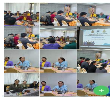
< การแลกเปลี่ยนเรียนรู้ ไร... โรงเรียนคุณภาพ 75 photos 8 ชั่วโมงที่ผ่านมา