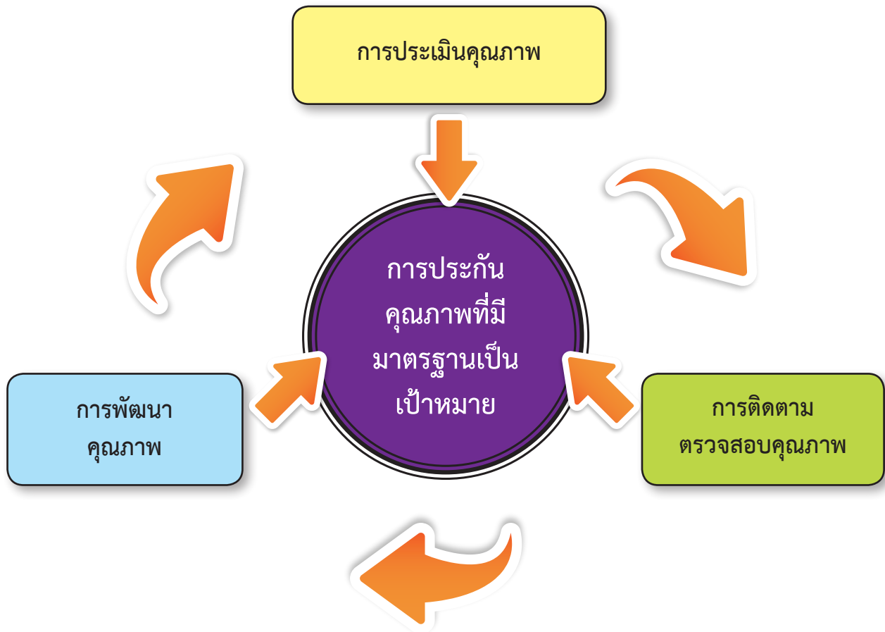
แผนภาพที่ ๑ ระบบการประกันคุณภาพการศึกษา

๓. การพัฒนาคุณภาพการศึกษา เป็นการดำเนินกิจกรรมใด ๆ เพื่อให้เกิดการยกระดับคุณภาพให้สูงขึ้น โดยมีมาตรฐานการศึกษาของสถานศึกษาเป็นเป้าหมาย ในการกำหนดมาตรฐานการศึกษาของสถานศึกษา ต้องสอดคล้องกับมาตรฐานการศึกษาชาติและมาตรฐานการศึกษาขั้นพื้นฐาน สถานศึกษาอาจเพิ่มเติมมาตรฐานที่เฉพาะเจาะจงเหมาะสมกับสภาพของชุมชนได้ มาตรฐานจะเป็นกรอบควบคุมการดำเนินงานให้บรรลุตามเป้าหมายที่กำหนดไว้