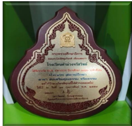
โรงเรียนคำม่วงจรัสวิทย์ได้รางวัลชมเชย กิจกรรม สวดมนต์หมู่สรรเสริญพระรัตนตรัย ประเภทหญิงล้วน ระดับจังหวัดกาฬสินธุ์