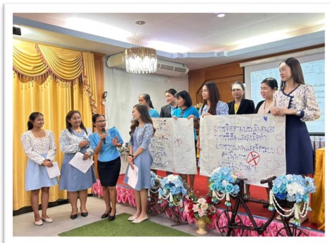
การอบรมพัฒนาทักษะ EF ปฐมวัย

โรงเรียนคุณภาพตามนโยบาย ๑ อำเภอ ๑ โรงเรียนคุณภาพ : โรงเรียนคำม่วงจรัสวิทย์