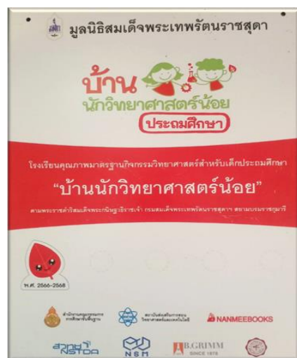
โรงเรียนคำม่วงจรัสวิทย์ได้รับรางวัลโรงเรียนคุณภาพ มาตรฐานกิจกรรมวิทยาศาสตร์

โรงเรียนคุณภาพตามนโยบาย ๑ อำเภอ ๑ โรงเรียนคุณภาพ : โรงเรียนคำม่วงจรัสวิทย์