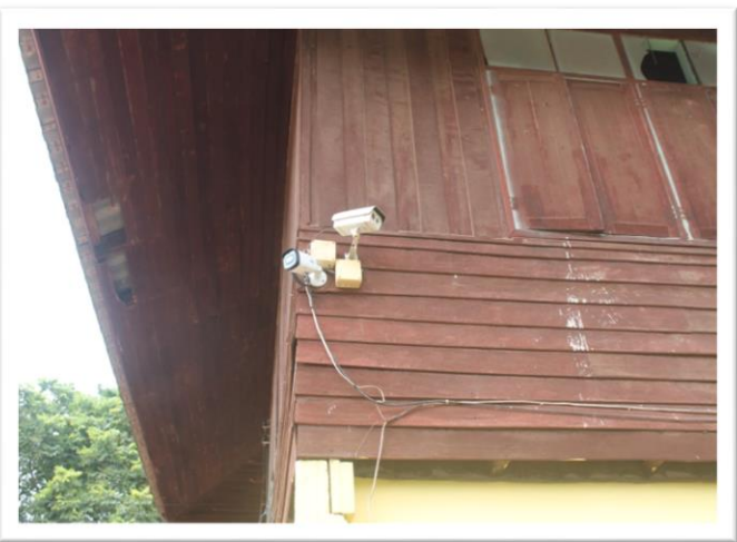
ระบบความปลอดภัยทุกอาคารมีกล้องวงจรปิด