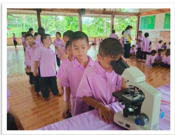
ร่วมกิจกรรมวันวิทยาศาสตร์ ปีการศึกษา ๒๕๖๗