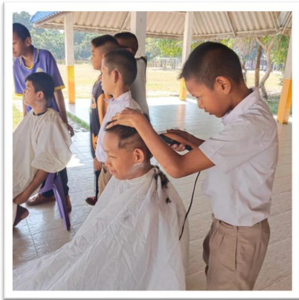
กิจกรรมสร้างเสริมทักษะอาชีพในวัยเรียน