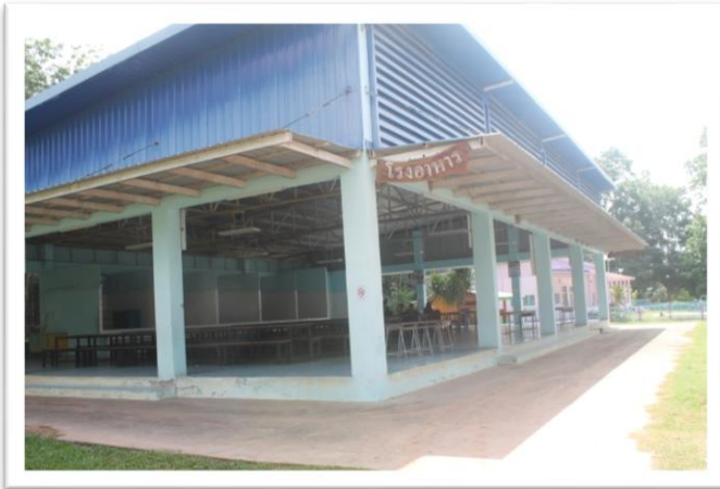
โรงอาหาร