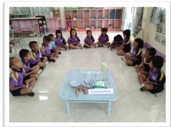
โรงเรียนมีวัสดุอุปกรณ์สำหรับการทำกิจกรรมนักเรียน

โรงเรียนคุณภาพตามนโยบาย ๑ อำเภอ ๑ โรงเรียนคุณภาพ : โรงเรียนคำม่วงจรัสวิทย์