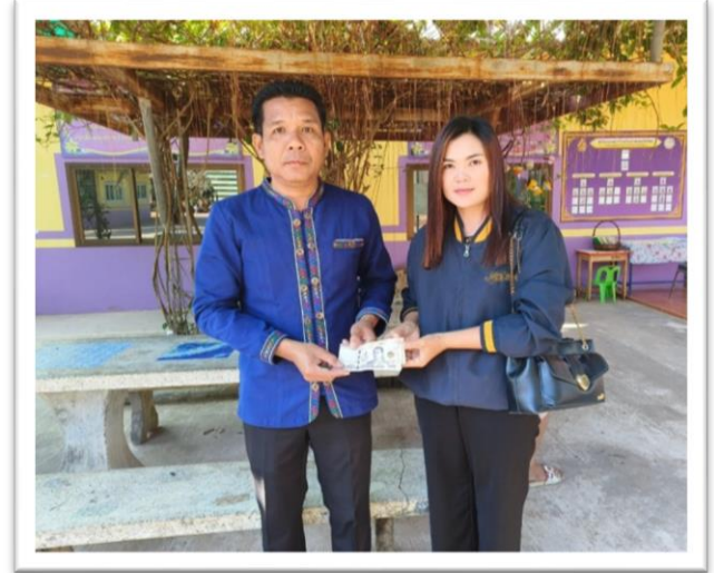
มอบทุน กศส.ตามโครงการปัจจัยพื้นฐานนักเรียนยากจน