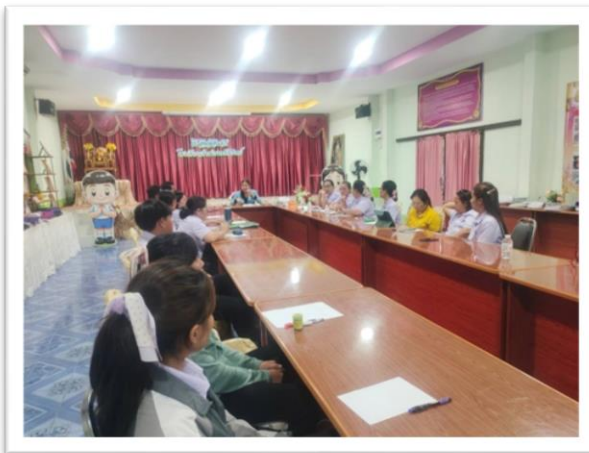
ผู้บริหารและคณะกรรมการประชุมจัดทำแผนคุณภาพประจำปี