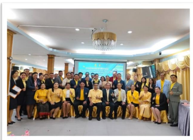
การอบรมการพัฒนาวิชาชีพด้านการการศึกษา