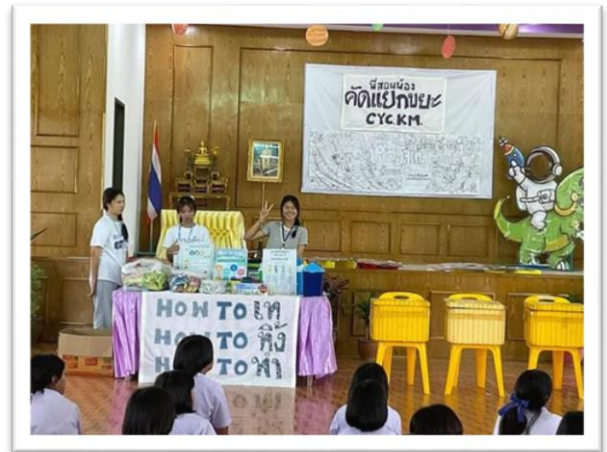
การกิจกรรมถอดบทเรียนการคัดแยกขยะ