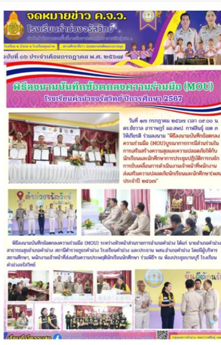
MOU ภาคีเครือข่าย