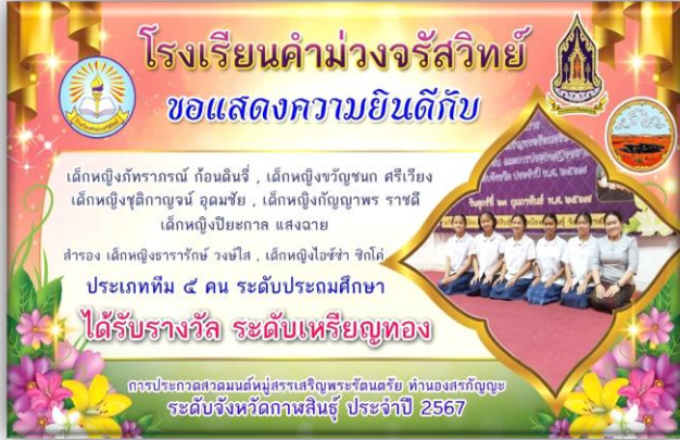
นักเรียนระดับประถมศึกษาหญิง ได้รับรางวัลเหรียญทอง กิจกรรมสวดมนต์หมู่สรรเสริญพระรัตนตรัย