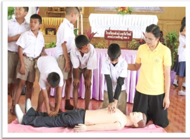
การอบรมการทำ CPR