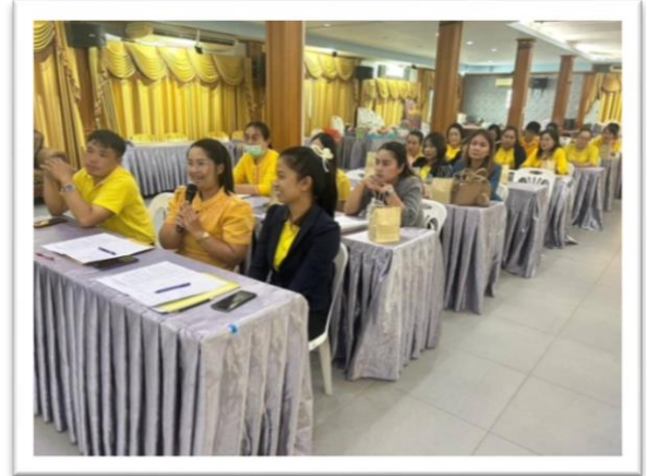
คณะครูได้เข้าร่วมอบรมบ้านนักวิทยาศาสตร์