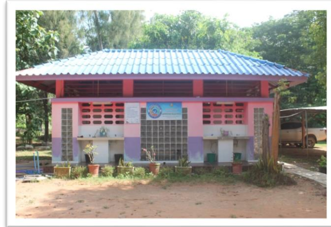
ห้องน้ำสะอาด