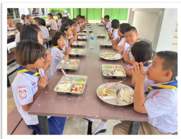
อาหารกลางวันตามโครงการอาหารกลางวันนักเรียน