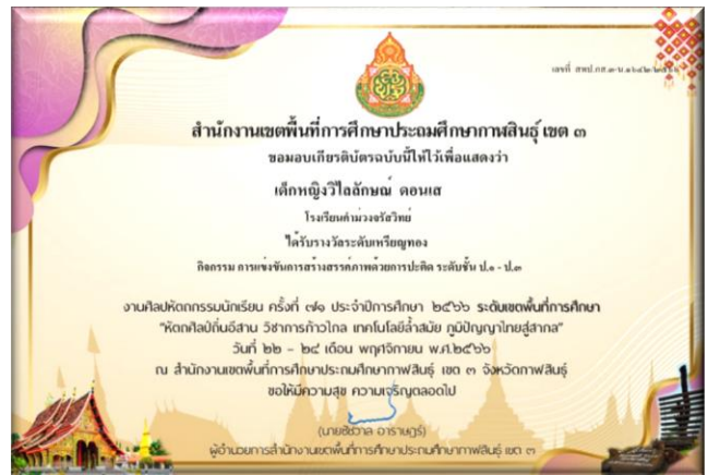
เด็กหญิงสิรินุกุล ชมภูทศน์ ได้รับรางวัลเหรียญทอง กิจกรรมการสร้างสรรค์ภาพด้วยการปะติด ระดับชั้น ป.๔-๖