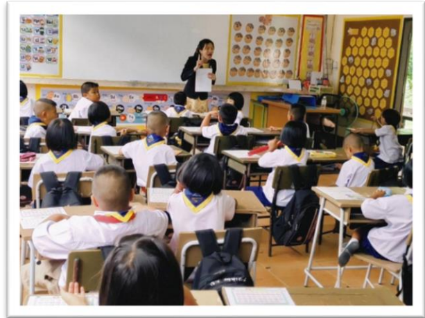
กิจกรรมการอ่านการเขียนระดับชั้น ป.๑-๓