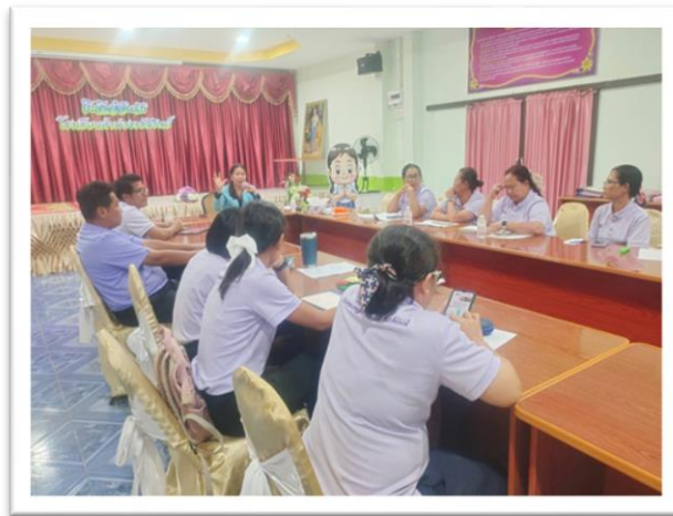
การประชุมปรับปรุง/พัฒนาหลักสูตรสถานศึกษา