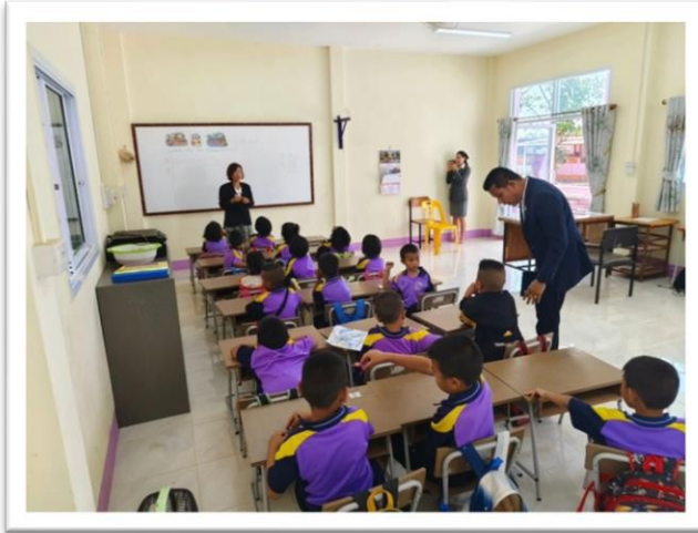
กิจกรรมการจัดประสบการณ์ระดับปฐมวัย