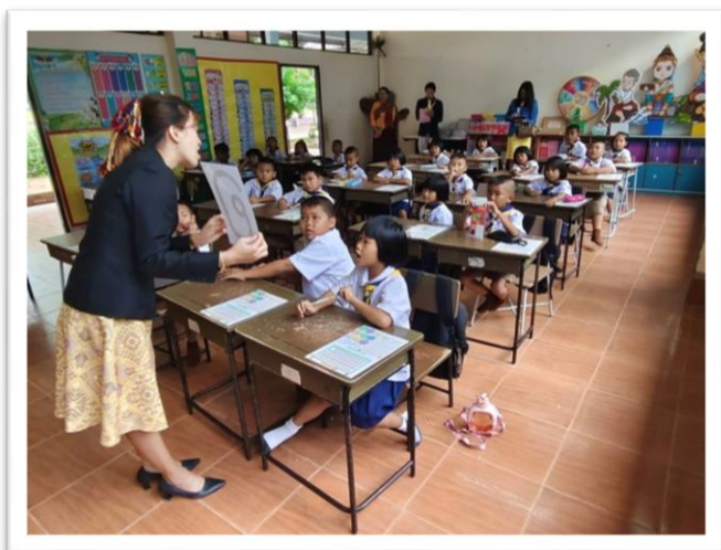
กิจกรรมลงสู่การปฏิบัติจริง