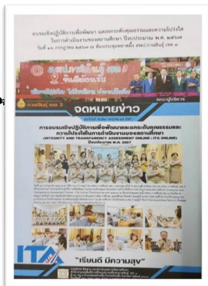
การอบรมพัฒนาคุณธรรมโปร่งใส (ITA)