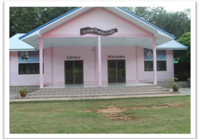
อาคารห้องสมุด