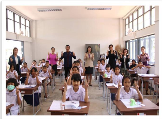
สอบ NT ระดับชั้น ป.๓