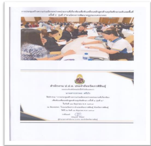
คณะครูได้เข้าร่วมอบรมหลักสูตรด้านทุจริต