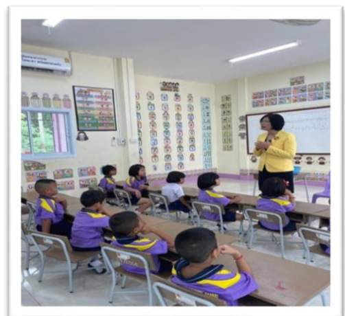
โรงเรียนมีโต๊ะเก้าอี้สำหรับนักเรียนครบทุกชั้นเรียน

โรงเรียนคุณภาพตามนโยบาย ๑ อำเภอ ๑ โรงเรียนคุณภาพ : โรงเรียนคำม่วงจรัสวิทย