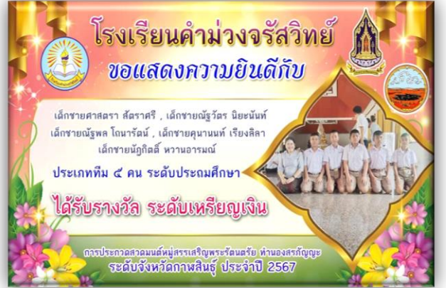
นักเรียนระดับประถมศึกษาชาย ได้รับรางวัลเหรียญเงิน กิจกรรมสวดมนต์หมู่สรรเสริญพระรัตนตรัย