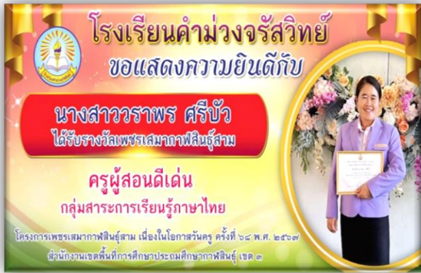
นางสาวราพร ศรีบัว ได้รับรางวัลครูผู้สอนดีเด่นกลุ่มสาระการเรียนรู้ภาษาไทย