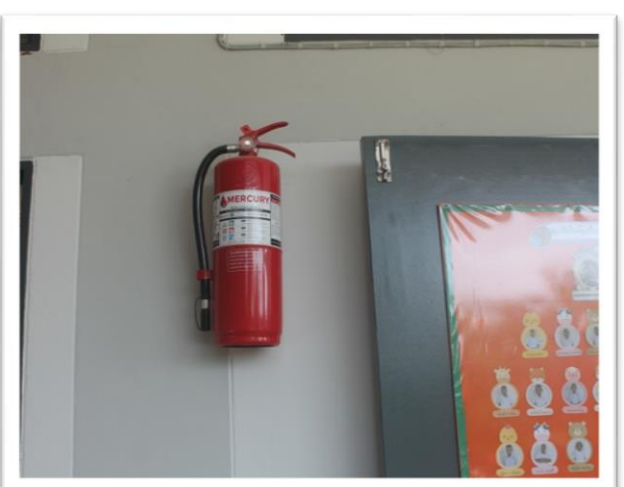
ระบบความปลอดภัยทุกอาคารมีถังดับเพลิง

โรงเรียนคุณภาพตามนโยบาย ๑ อำเภอ ๑ โรงเรียนคุณภาพ : โรงเรียนคำม่วงจรัสวิทย์