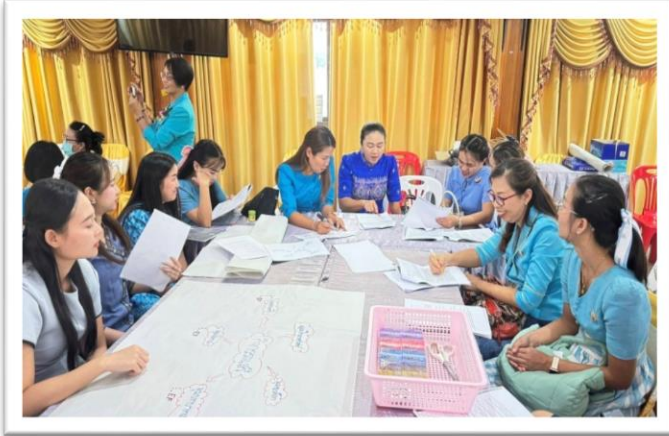
คณะครูได้เข้าร่วมอบรมด้านปฐมวัย