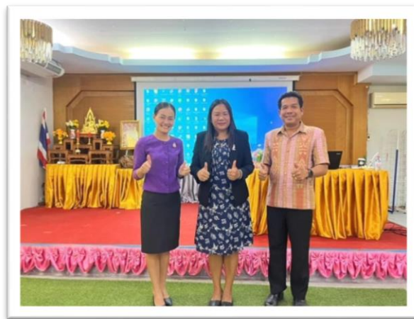
ผู้บริหารร่วมอบรมระบบการเงินการบัญชี