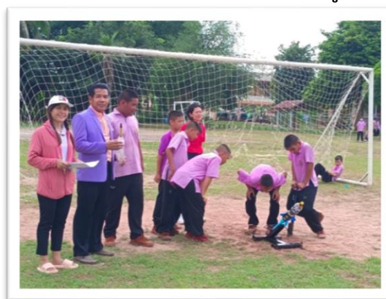
เข้าร่วมการแข่งขันจรวดขวดน้ำ กิจกรรมวันวิทยาศาสตร์