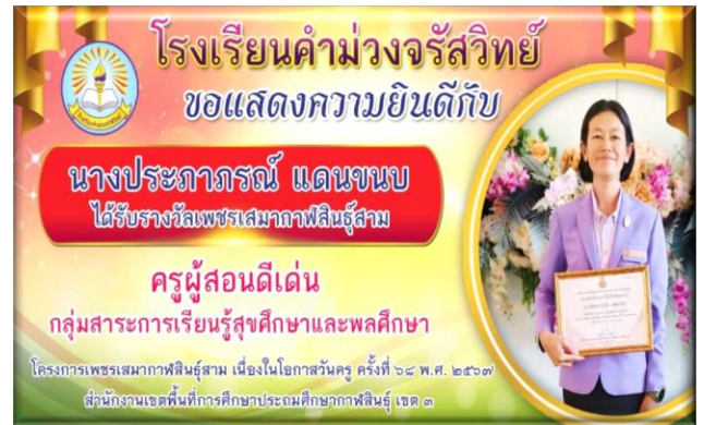
นางปภาภรณ์ แดนชนบ ได้รับรางวัลครูผู้สอนดีเด่นกลุ่มสาระการเรียนรู้ สุศึกษาและพลศึกษา