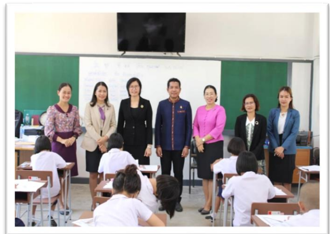
การนิเทศการจัดการเรียนการสอน