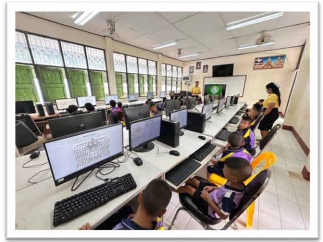
เรียนรู้ด้านเทคโนโลยีชั้นปฐมวัย