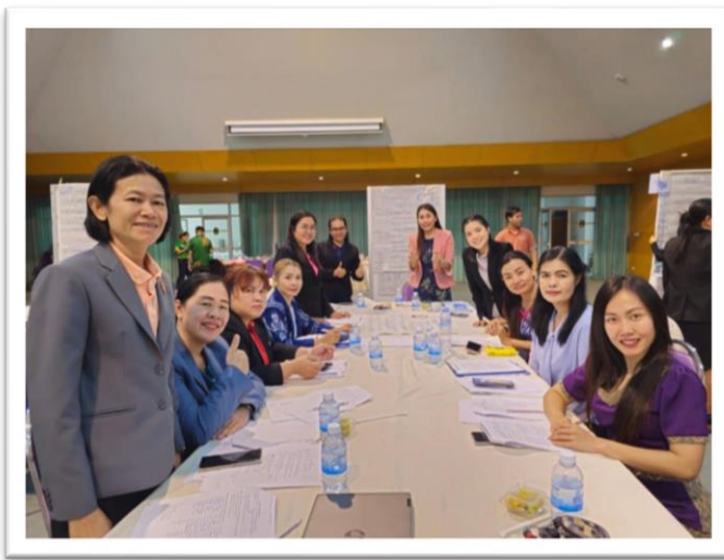
ครูเข้าอบรมพัฒนา ครูมีอาชีพ