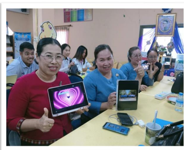
คณะครูได้เข้าร่วมอบรมด้านสื่อดิจิทัล

โรงเรียนคุณภาพตามนโยบาย ๑ อำเภอ ๑ โรงเรียนคุณภาพ : โรงเรียนคำม่วงจรัสวิทย์