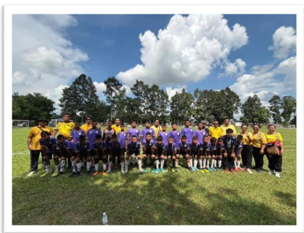
การแข่งขันกีฬาข้ามวงค์