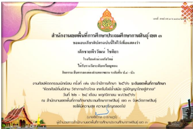
เด็กชายพีรวัฒน์ โชติกา ได้รับรางวัลเหรียญทอง กิจกรรมสวดมนต์หมู่สรรเสริญพระรัตนตรัย ระดับ ป.๔-๖