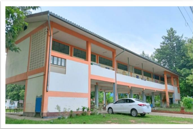
อาคารเรียนประถมศึกษา