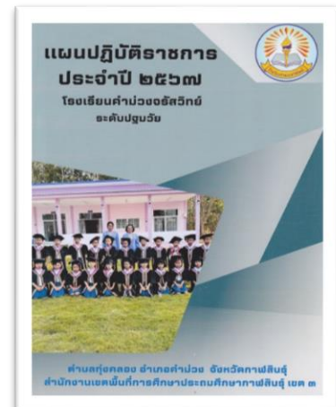
แผนปฏิบัติการประจำปี พ.ศ.๒๕๖๓