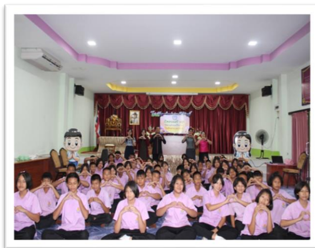
กิจกรรมเปิดเทอมสร้างสุข ให้ความรักก่อนให้ความรู้