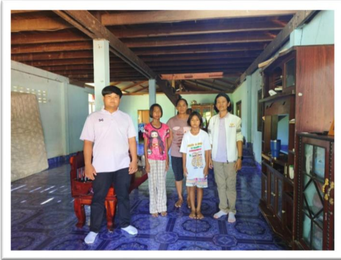
ครูที่ปรึกษาเยี่ยมบ้านนักเรียนตามโครงการระบบดูแลช่วยเหลือนักเรียน