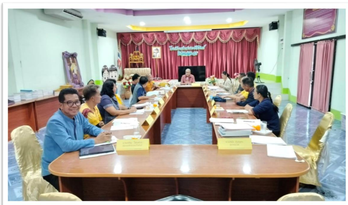
การประชุมคณะกรรมการการศึกษาขั้นพื้นฐาน ปีการศึกษา ๒๕๖๗