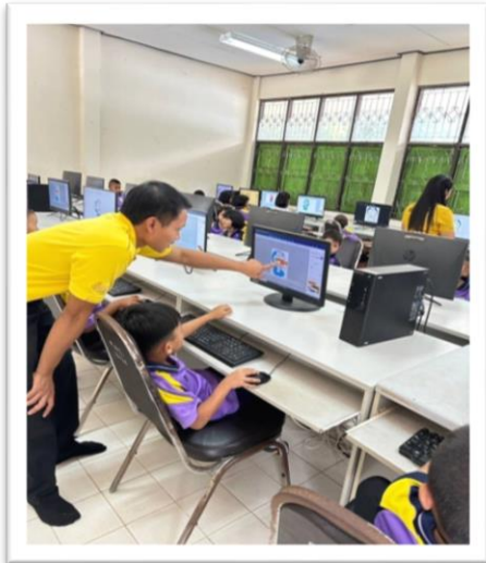
โรงเรียนมีห้องคอมพิวเตอร์และอินเทอร์เน็ตความเร็วสูงสำหรับการเรียนรู้