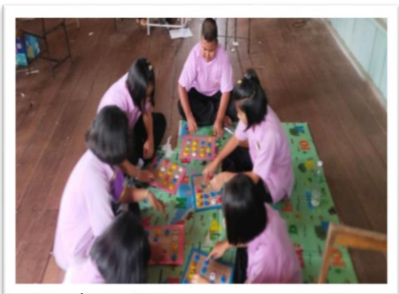
โรงเรียนมีสื่อ/นวัตกรรมสำหรับใช้ในการจัดกิจกรรมที่เหมาะสมและหลากหลาย