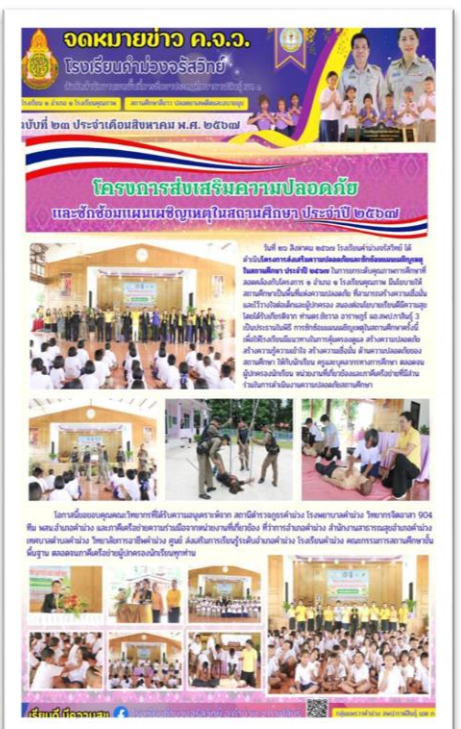
ความปลอดภัยในสถานศึกษา