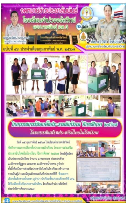
ประชาธิปไตยในโรงเรียน