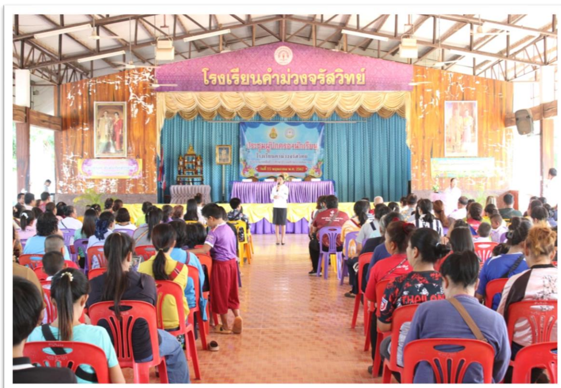
การประชุมผู้ปกครอง ปีการศึกษา ๒๕๖๗

โรงเรียนคุณภาพตามนโยบาย ๑ อำเภอ ๑ โรงเรียนคุณภาพ : โรงเรียนคำม่วงจรัสวิทย์