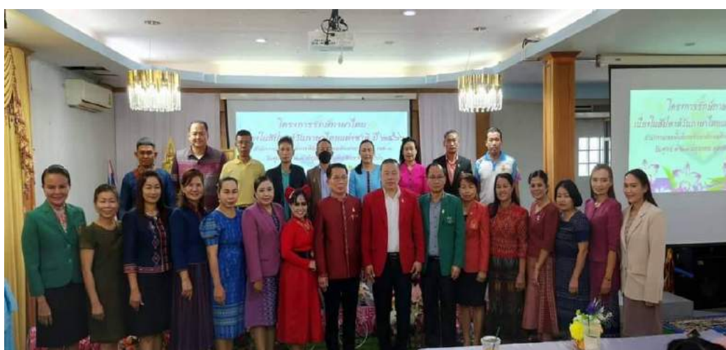
(13) โครงการพัฒนาสมรรถนะการอ่านขั้นสูงของนักเรียน ม.ต้น สอดคล้องกับ