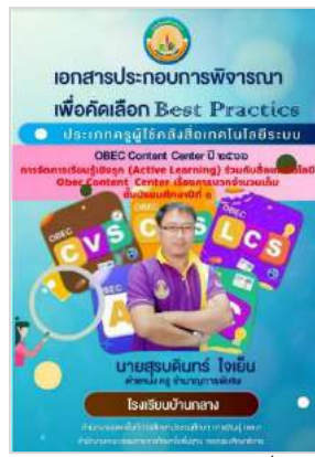
นายสุรบดินทร์ ใจเย็น ร.ร.บ้านกลาง