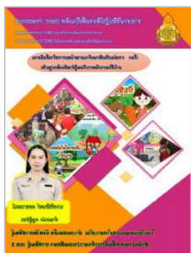
นางพัชรินทร์ ตลอารมณ ร.ร.หนองแสงวิทยาเสริม