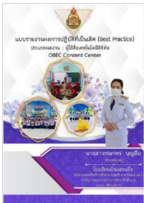
นางสาวกนกพร บุญถือ ร.ร.บ้านสวนผึ้ง