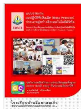
นายอภิเชษฐ์ ศรีงามเมือง ร.ร.บ้านสี่แยกสมเด็จ

ฉบับเต็ม : https://drive.google.com/drive/folders/1tikm9RAAHAEsrpkxgH_yiFf6-4lOJt8y?usp=sharing