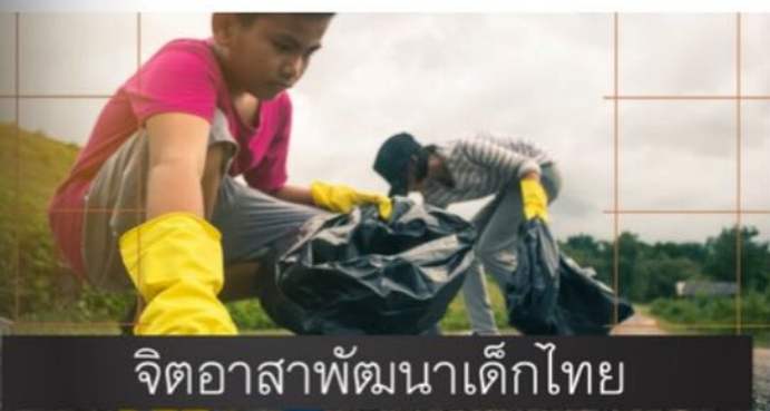
จิตอาสาพัฒนาเด็กไทย