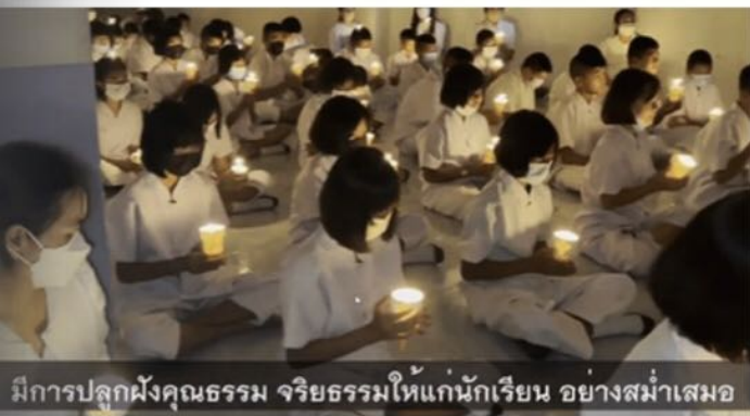
มีการปลูกฝังคุณธรรม จริยธรรมให้แก่นักเรียน อย่างสม่ำเสมอ