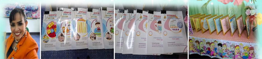
ภาพประกอบ 8 บูธนิทรรศการและกรรปฏิบัติงานสมาคมครูบ้านแก้วพิจิตรนิเทศ