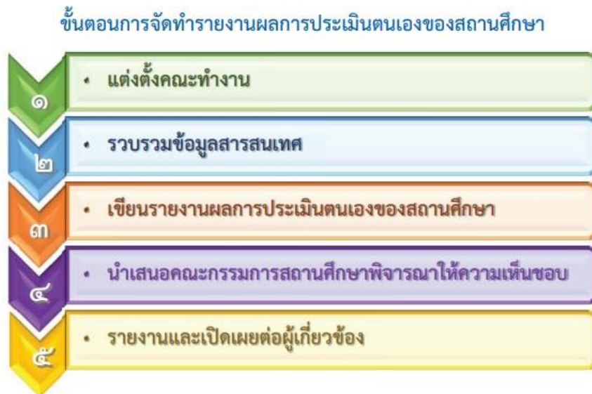
แผนภาพที่ ๑ แสดงขั้นตอนการจัดทำรายงานผลการประเมินตนเองของสถานศึกษา

การจัดทำรายการผลการประเมินตนเองของสถานศึกษาเป็นสิ่งที่ต้องให้ความสำคัญและต้องมีการทำงานอย่างเป็นระบบเพื่อให้ได้รายงานที่สะท้อนผลการดำเนินงานที่ถูกต้อง ชัดเจน และสมบูรณ์ ดังนั้น สถานศึกษาจึงควรมีขั้นตอนการดำเนินงาน ดังนี้