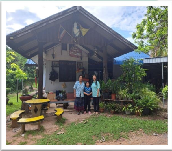
ครูที่ปรึกษาเยี่ยมบ้านนักเรียนตามโครงการระบบดูแลช่วยเหลือนักเรียน