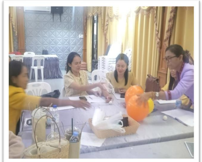
คณะครูได้เข้าร่วมอบรมบ้านนักวิทยาศาสตร์