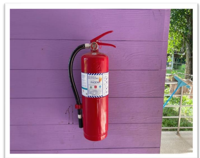
ระบบความปลอดภัยทุกอาคารมีถังดับเพลิง