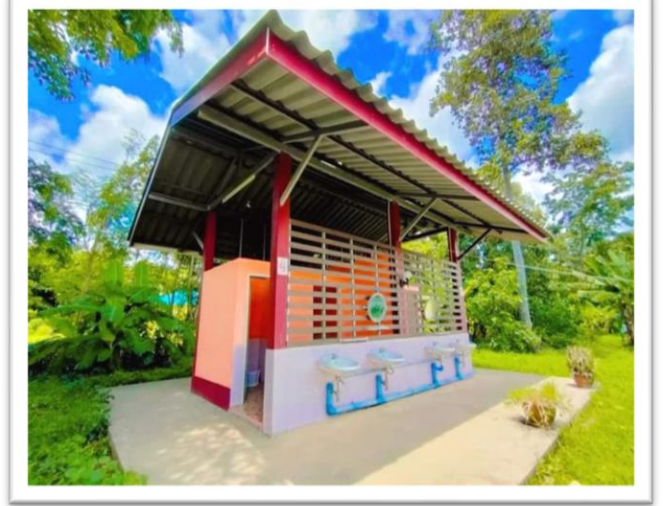
ห้องน้ำสะอาด