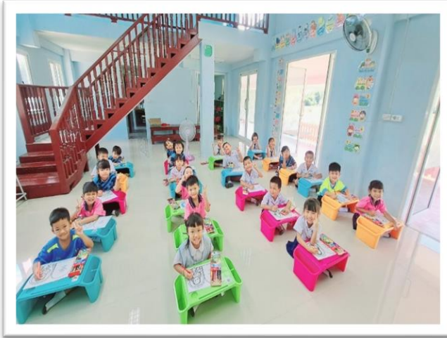
กิจกรรมการจัดประสบการณ์ระดับปฐมวัย