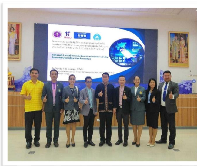
การอบรมการขับเคลื่อนโรงเรียนขนาดเล็กในพื้นที่จังหวัดกาฬสินธุ์