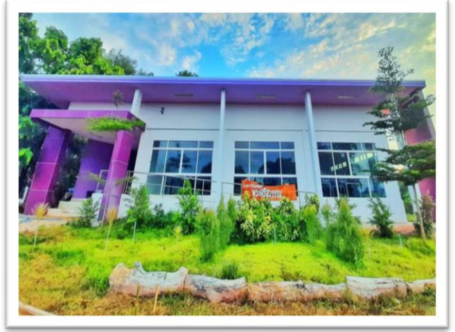
อาคารห้องสมุด