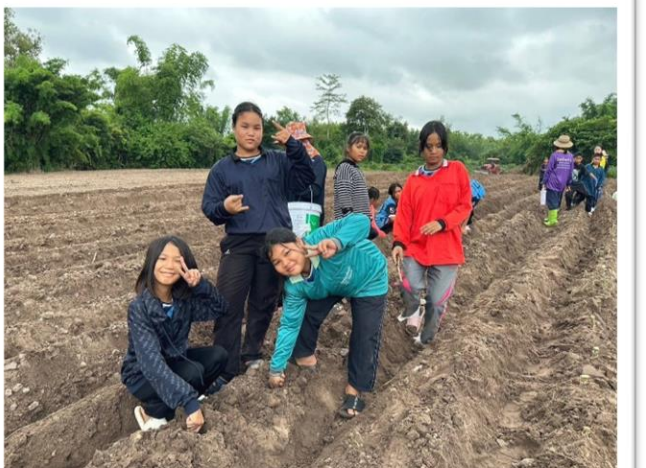
กิจกรรมสร้างเสริมทักษะอาชีพเศรษฐกิจพอเพียง