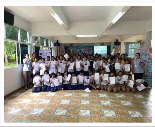
การอบรมโครงการสุขภาพนักเรียน