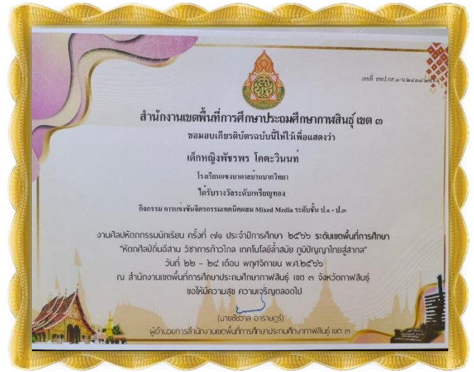
เด็กหญิงพัชรพร โคตะวินนทร์ ได้รับรางวัลเหรียญทอง กิจกรรมจิตรกรรมเทคนิคผสม ระดับ ป.๑-๓