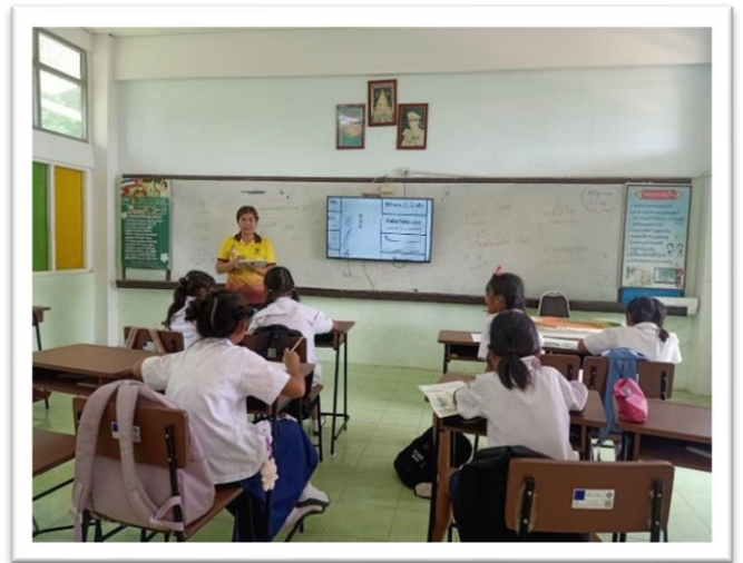
โรงเรียนมีโทรทัศน์จอLED ทุกห้องเรียนเพื่อใช้ในการจัดกิจกรรมการเรียนการสอน