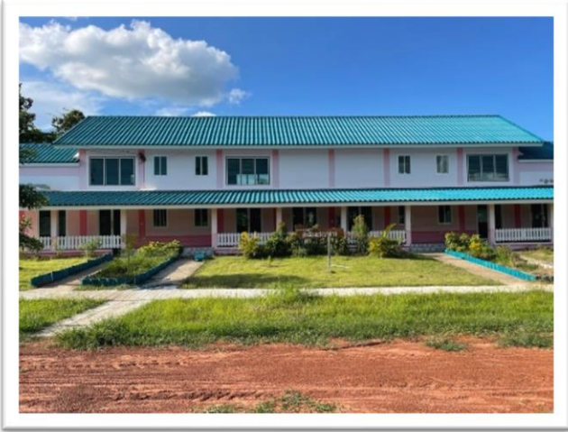
อาคารเรียนอนุบาล