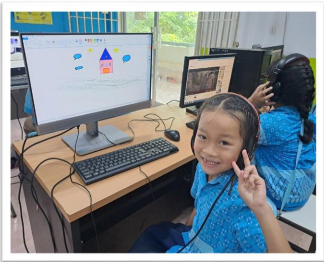
โรงเรียนมีห้องคอมพิวเตอร์และอินเทอร์เน็ตความเร็วสูงสำหรับการเรียนรู้