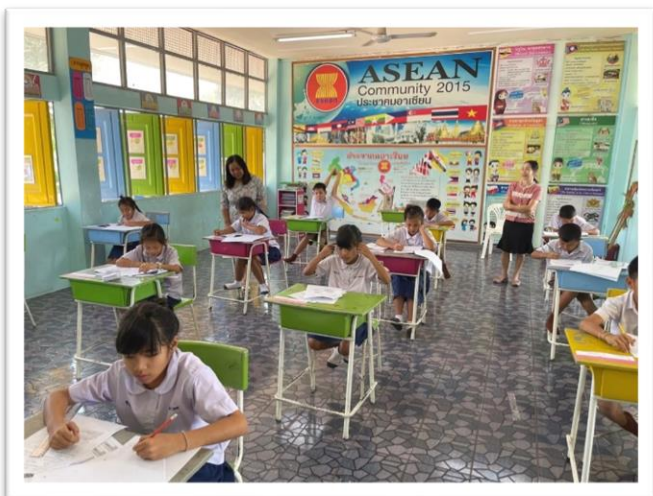
การทดสอบ NT ของนักเรียนชั้น ป.๓