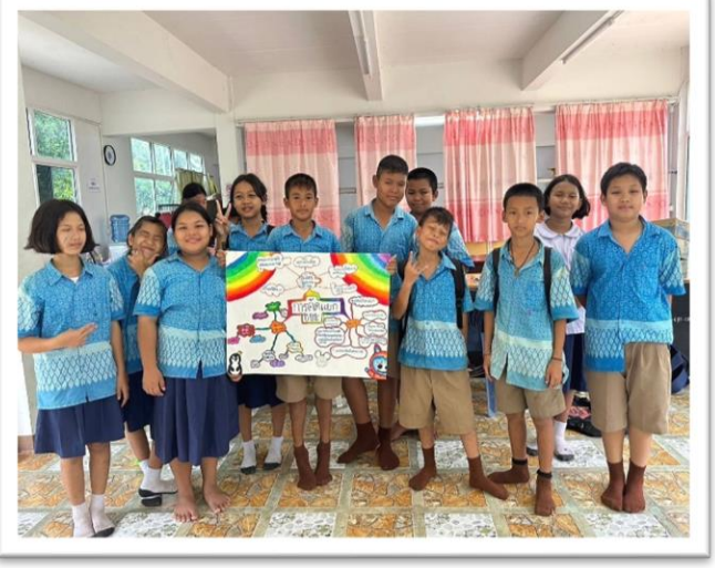
การกิจกรรมถอดบทเรียนการคัดแยกขยะ