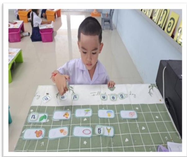
โรงเรียนมีสื่อ/นวัตกรรมสำหรับใช้ในการจัดกิจกรรมที่เหมาะสมและหลากหลาย