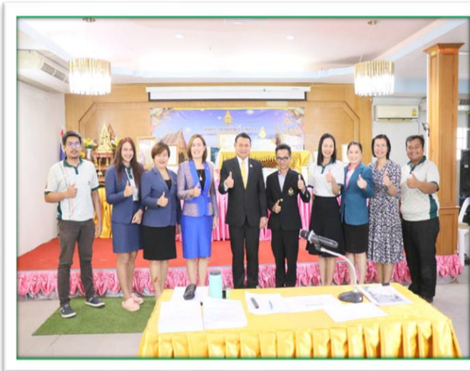
การอบรมการพัฒนาวิชาชีพด้านการการศึกษา