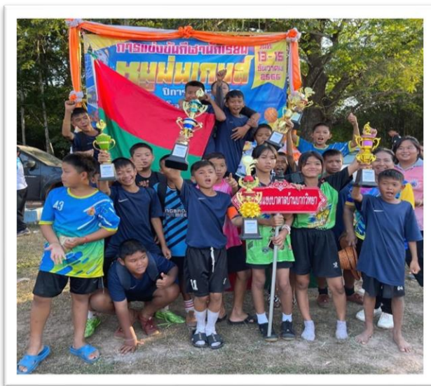
การแข่งขันกีฬาด้านยาเสพติด