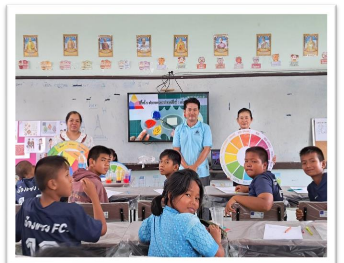
การนิเทศการจัดการเรียนการสอน