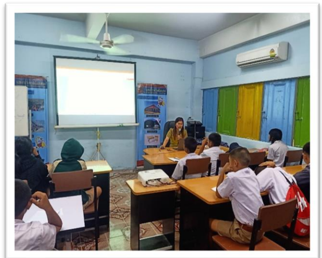
กิจกรรมการติวเข้มสำหรับการทดสอบ O-net ชั้น ป.๕-๖