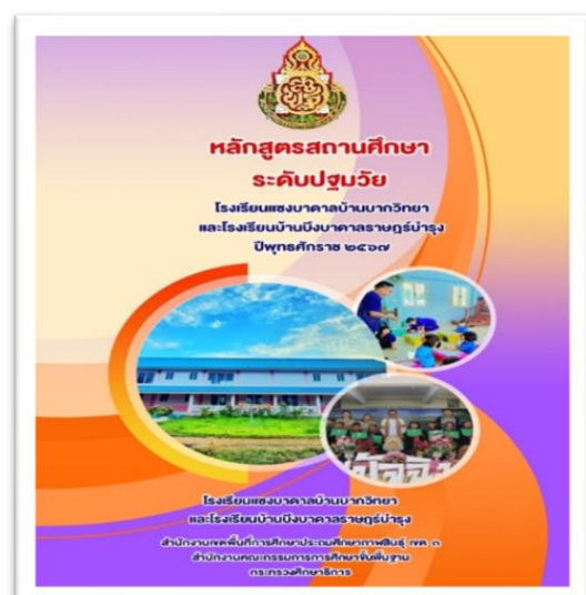
หลักสูตรสถานศึกษา