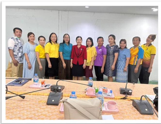
ประชุมคณะวิทยากรโครงการเสริมสร้างศักยภาพครูฯ