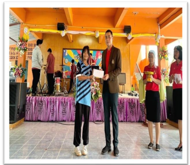
เข้าร่วมการแข่งขันวิชาการ กิจกรรมเปิดบ้านวิชาการ โรงเรียนมหาชัยพิทยาคม