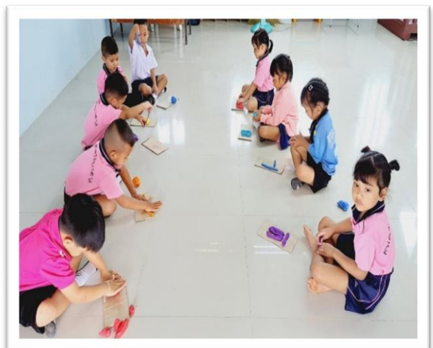
โรงเรียนมีวัสดุอุปกรณ์สำหรับการทำกิจกรรมนักเรียน