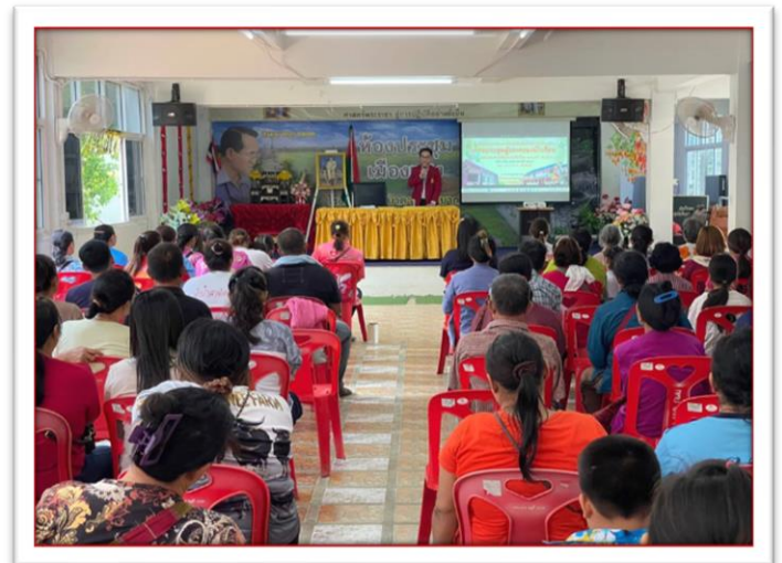
การประชุมผู้ปกครองนักเรียน