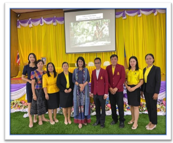
คณะครูได้เข้าร่วมอบรมการแก้ไขปัญหาด้านอ่านออกเขียนได้นักเรียน