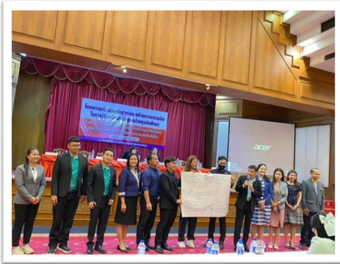
คณะครูได้เข้าร่วมอบรมเกี่ยวกับหลักสูตรด้านทุจริต