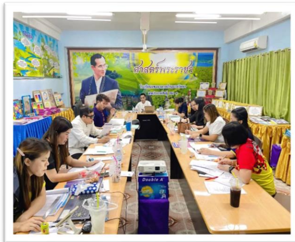
การประชุมปรับปรุง/พัฒนาหลักสูตรสถานศึกษา