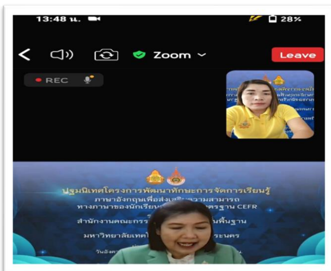
การอบรมพัฒนาทักษะการจัดการเรียนรู้ภาษาอังกฤษ