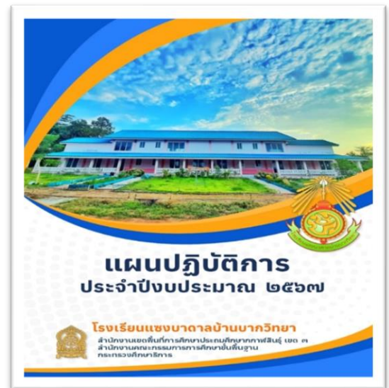
แผนปฏิบัติการปี พ.ศ.๒๕๖๓