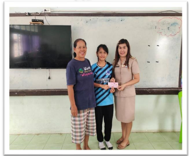
มอบทุน กศส.ตามโครงการปัจจัยพื้นฐานนักเรียนยากจน