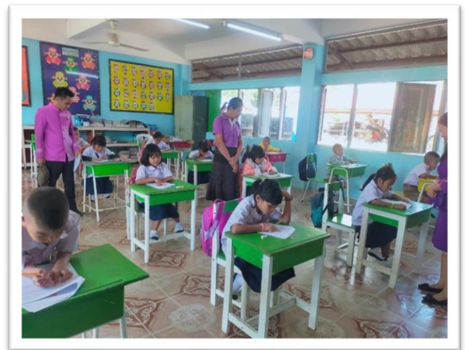
การทดสอบ RT ของนักเรียนชั้น ป.๑