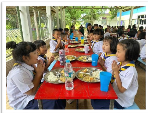
อาหารกลางวันตามโครงการอาหารกลางวันนักเรียน