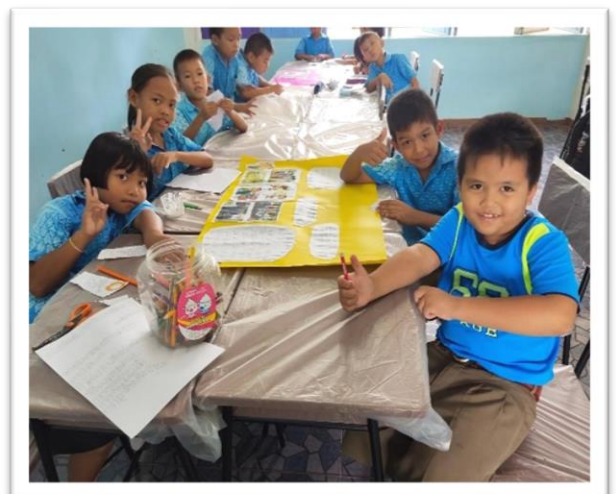
โรงเรียนมีโต๊ะเก้าอี้สำหรับนักเรียนครบทุกชั้นเรียน