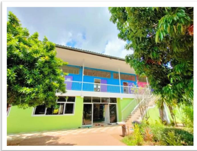
อาคารเรียนประถมศึกษา