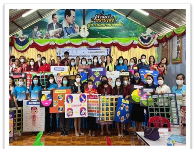
คณะครูได้เข้าร่วมอบรมการผลิตสื่อ/นวัตกรรม