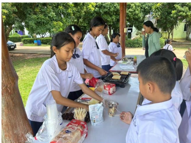
กิจกรรมสร้างเสริมทักษะอาชีพในวัยเรียน