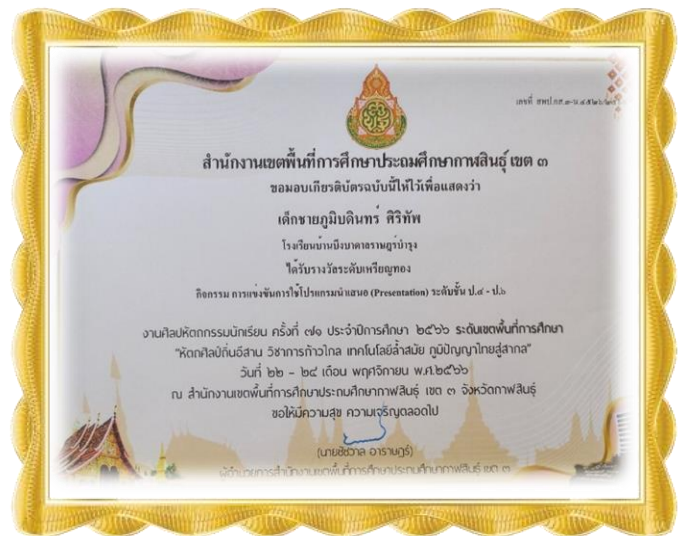
เด็กหญิงสิรินกุล ชมภูทัตน์ ได้รับรางวัลเหรียญทอง กิจกรรมการใช้โปรแกรมนำเสนอ ระดับชั้น ป.๔-๖