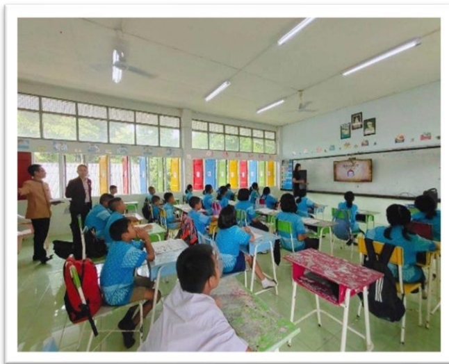
กิจกรรมการอ่านการเขียนระดับชั้น ป.๔-๖