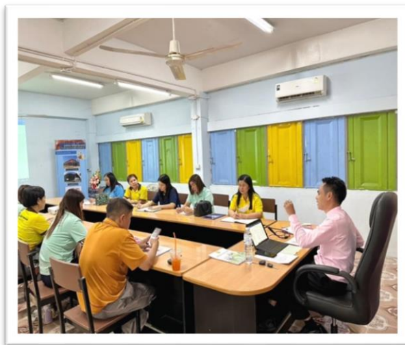
ผู้บริหารและคณะกรรมการประชุมจัดทำแผนคุณภาพประจำปี