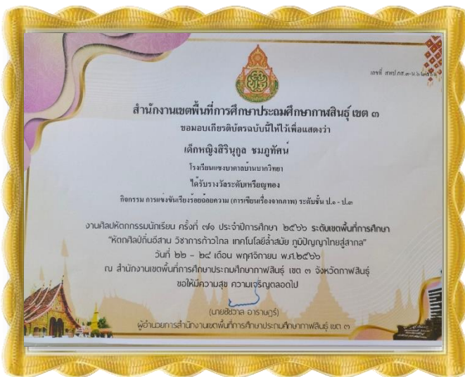
เด็กหญิงสิรินกุล ชมภูทัตน์ ได้รับรางวัลเหรียญทอง กิจกรรมเรียงร้อยถ้อยความ ระดับ ป.๑-๓