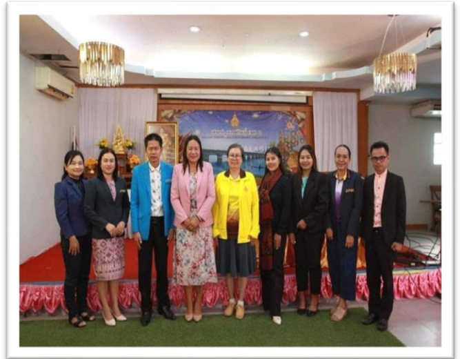
ผู้บริหารร่วมอบรมระบบการเงินการบัญชี