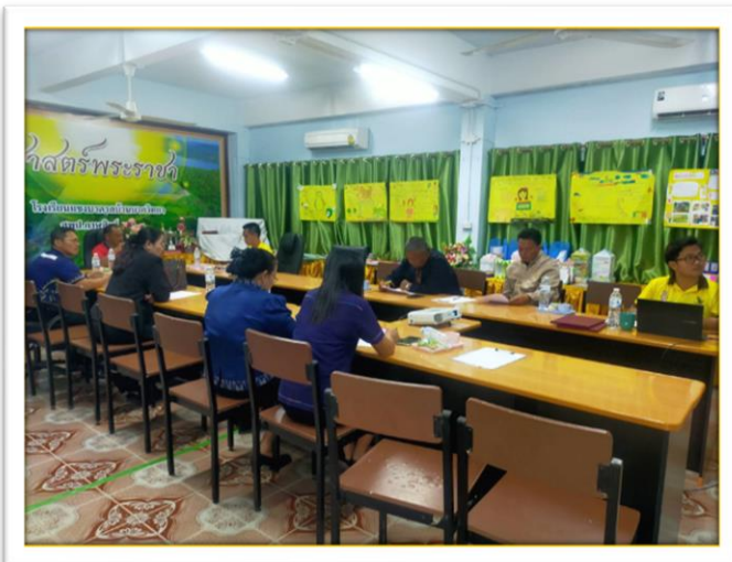
การประชุมคณะกรรมการสถานศึกษา