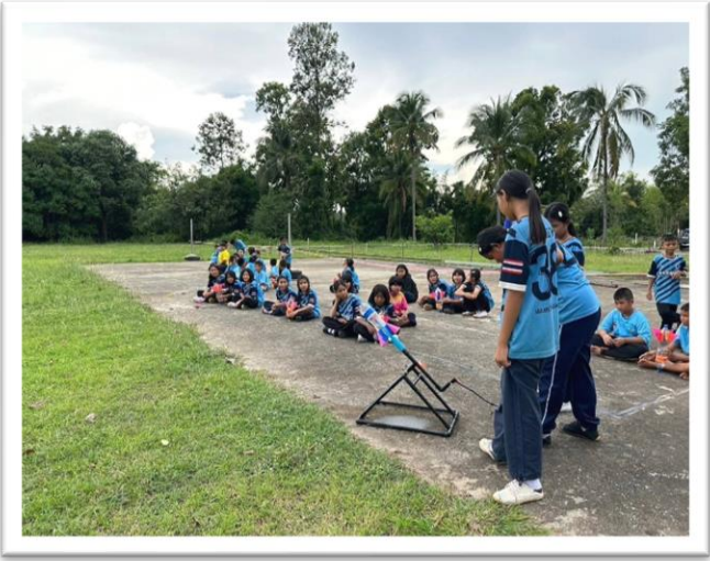
เข้าร่วมการแข่งขันกิจกรรมวันวิทยาศาสตร์