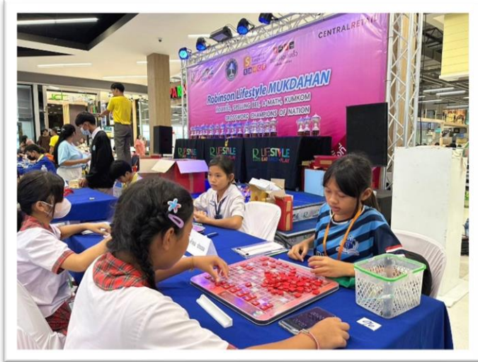
เข้าร่วมการแข่งขันเกมกีฬาทางวิชาการต่อคำศัพท์ ภาษาไทย(คำคม)