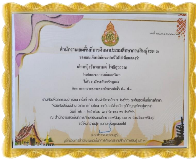
เด็กหญิงจันทกานต์ โพธิ์สุวรรณ ได้รับรางวัลเหรียญทอง กิจกรรมประกวดมารยาทไทย ระดับ ป.๑-๓