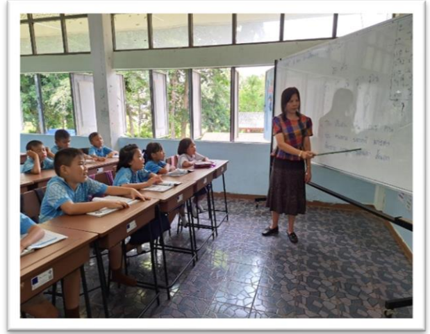
กิจกรรมการอ่านการเขียนระดับชั้น ป.๑-๓