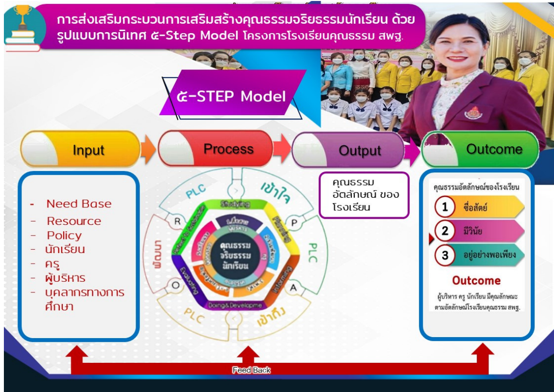
แผนภาพ การส่งเสริมกระบวนการเสริมสร้างคุณธรรม จริยธรรมนักเรียน ด้วยรูปแบบการนิเทศ ๕-Step Model